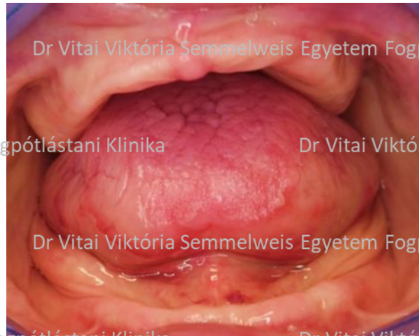
Enyhén nyitott helyzet